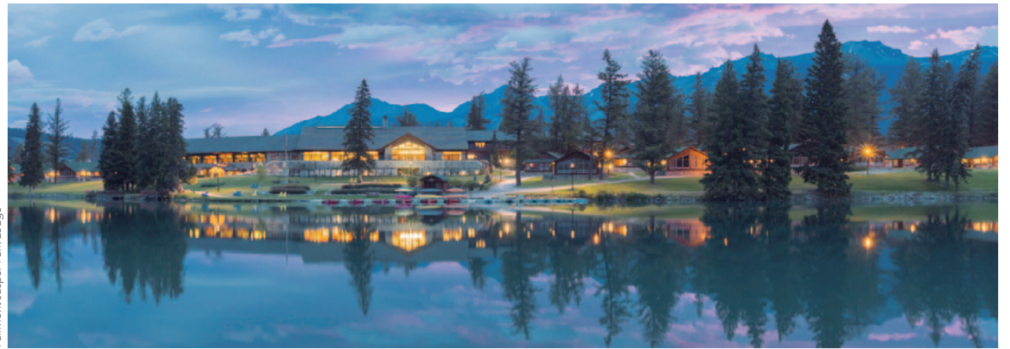
Fairmont Jasper Park Lodge