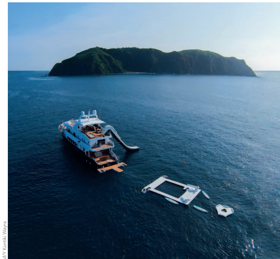
M/Y Kontiki Wayra